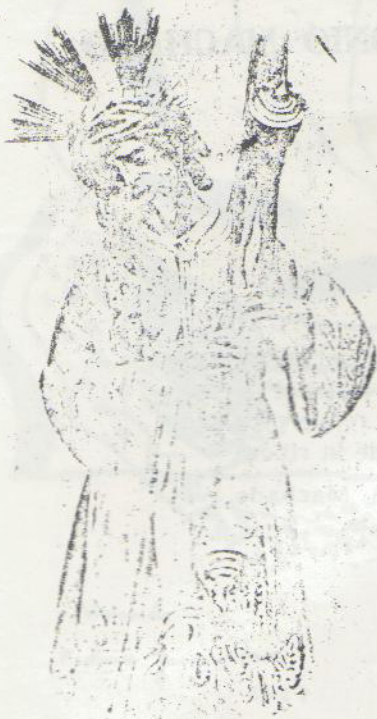
Huestro Señor Cristo del Gran Poder.